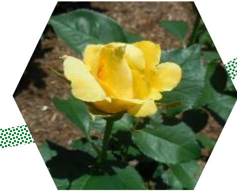
Fiori e piante ornamentali