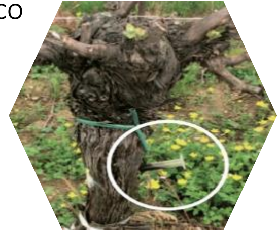
Iniezione al tronco

Facile e conveniente per colture in serra e in campo aperto.